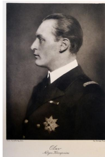
Olav. Norges Kronprins. Fotograf: Ernest Rude, udatert. Abels Kunstforlag, Oslo. Eier: Nasjonalbiblioteket