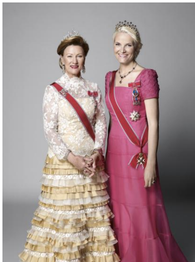
H.M. Dronning Sonja og Kronprinsesse Mette-Marit. Publisert 22.01 2011.