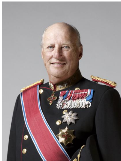
H.M. Kong Harald. Publisert 22.01.2011